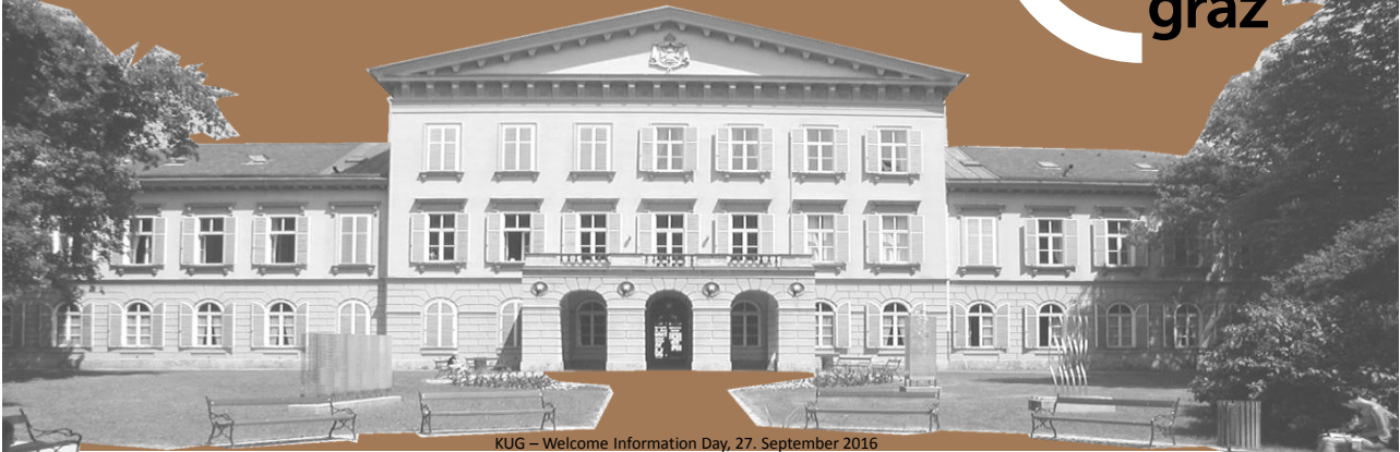
KUG – Welcome Information Day, 27. September 2016